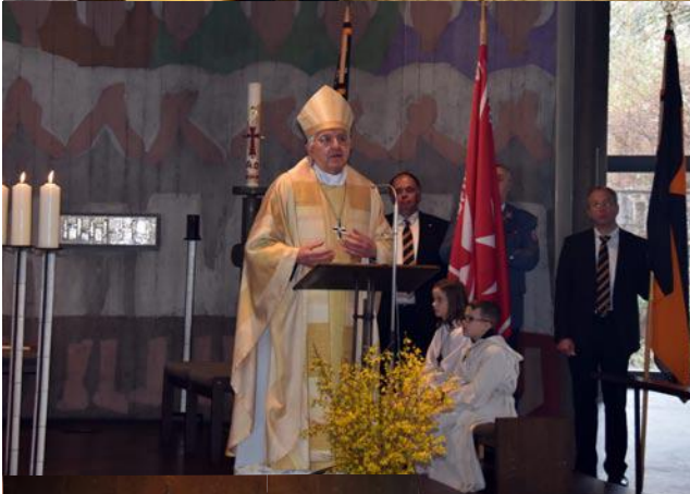
Impressionen vom Josefstag 19.03.2023